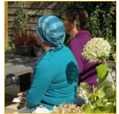
Het eerste contactmoment met mensen met kanker en hun naasten vindt doorgaans plaats door inloop in het huis.

Het eerste contactmoment met mensen met kanker en hun naasten vindt meestal plaats door inloop in het huis. Dit kan in iedere fase van het ziekte- of genezingsproces zijn. Sommige gasten komen direct na de diagnose, andere gasten komen als het medische traject achter de rug is en ze de draad van het dagelijkse leven weer gaan oppakken. Voor gasten is de spreekwoordelijke drempel om de eerste keer binnen te lopen vaak hoog. Daarom is het van groot belang dat gasten met de grootste zorg, aandacht en warmte ontvangen worden door gastvrouwen en gastheren. Het ontmoeten van andere gasten die in een vergelijkbaar proces zitten, geeft herkenning en erkenning. Het delen van ervaringen en gevoelens is voor de meeste gasten van toegevoegde waarde. Dit is ook de reden waarom wij in 2011 begonnen zijn met de koffie-inloopochtenden voor mensen met kanker en hun naasten. In een ontspannen