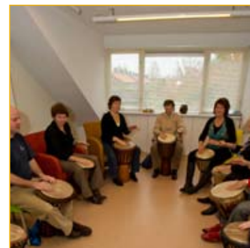
Evenals in de jaren ervoor is het bezoekersaantal boven verwachting toegenomen.

In bijlage 1 is een gedetailleerd overzicht van de instroom opgenomen.