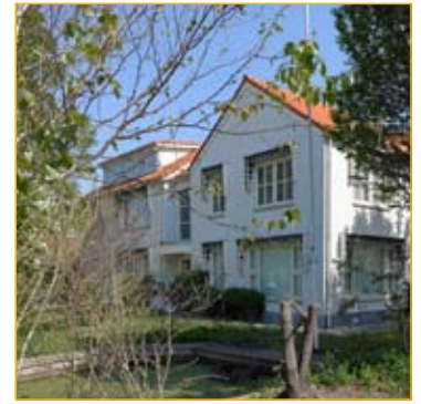
In vijf jaar tijd is het Adamas Inloophuis al 28.500 keer bezocht.

Het Adamas Inloophuis heeft inmiddels een belangrijke plek verworven in de psychosociale begeleiding en ondersteuning van mensen met kanker en hun naasten in de regio, en onderhoudt warme contacten met andere instellingen binnen de zorgketen. De belangrijkste taak dit jaar was te onderzoeken hoe, middels structurele financiering, de continuïteit van onze dienstverlening gewaarborgd kan worden. Zodat we ook in de toekomst mensen in de meest ingrijpende periode in hun leven kunnen blijven ondersteunen.