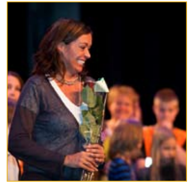
In het inloophuis zijn 4 coördinatoren, 15 therapeuten en 106 vrijwilligers actief.

Een groeiende organisatie heeft steeds meer behoefte aan structuur. In 2011 is een aanvang gemaakt met het protocolleren, structureren en categoriseren van processen en informatie(stromen). Als eerste stap in dat proces zijn een achttal categorieën vastgesteld waarin de activiteiten van Adamas worden ingedeeld. Door deze categorisering door de gehele organisatie toe te passen