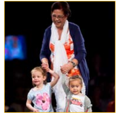
De modeshow voor en door mensen met kanker liet de modellen stralen op de catwalk.

Helaas overlijden er ook regelmatig gasten van het Adamas Inloophuis. Jaarlijks organiseren we een herdenkingsbijeenkomst voor de nabestaanden van overleden gasten. Dit geeft de nabestaanden de gelegenheid om op een plek waar hun dierbare het als fijn en vertrouwd heeft ervaren, stil te staan bij het verdriet en te herdenken. Tijdens deze bijeenkomst krijgen de nabestaanden de gelegenheid om een gedicht of muziek in te brengen zodat deze bijeenkomst een persoonlijk invulling krijgt.