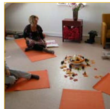
Het aantal yogagroepen is in 2011 uitgebreid.

In 2011 hebben we in samenwerking met het Ingeborg Douwes Centrum (een therapeutisch centrum voor mensen met kanker en hun naasten in Amsterdam) 4 mindfulness trainingen kunnen verzorgen voor gasten en één training voor hulpverleners. Uit de enquêtes onder gasten blijkt dat deze de verdiepende training van grote toegevoegde waarde voor hun helingsproces ervaren. Deelnemers konden in 2011 in aanmerking komen voor vergoeding door hun zorgverzekering.