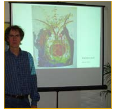
In 2011 heeft het Adamas Inloophuis lezingen georganiseerd over diverse aan kanker gerelateerde onderwerpen.

Onze gasten leven vaak in een onzekere en heftige periode, waarin ze veel vragen hebben rondom kanker. We ondersteunen onze gasten in deze periode, en proberen ze te helpen om de antwoorden op hun vragen te vinden. Inmiddels hebben wij veel informatie verzameld en hebben we contact met een groot