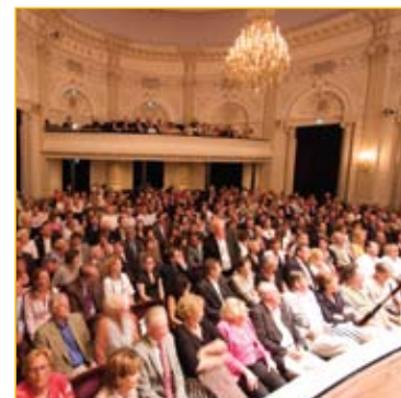
De serviceclubs uit de regio hebben ons op vele manieren ondersteund.

Ook werd er een sponsorfietstocht (Parijs-Kaag) en een golftoernooi voor ons georganiseerd, die beiden geld hebben opgeleverd voor het inloophuis.