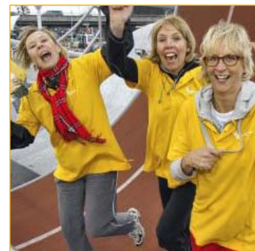
Medewerkers van Adamas liepen mee in het Wheel of Energy, om aandacht te vragen voor de noodzaak van psychosociale (na)zorg bij kanker.

Een van onze belangrijkste speerpunten in 2011 was om de continuïteit van het Adamas Inloophuis te garanderen. Niet afwachten maar juist zélf het initiatief en de verantwoordelijkheid nemen is een van de sterkste kanten van onze organisatie. Begin januari ontstond daarom een ambitieus plan voor een grote donateurwervingsactie: Kilimas 2012.