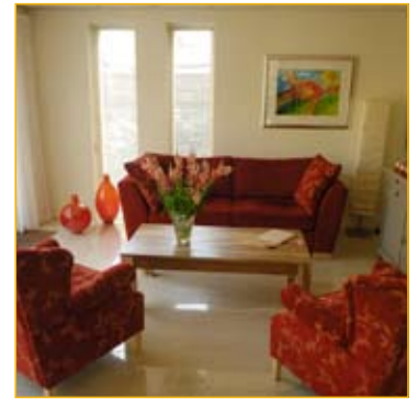
In het inloophuis worden gasten ontvangen in een warme, huiselijke omgeving.

Deze doelstellingen zijn ruimschoots gerealiseerd. Met ingang van 2011 zijn we naast de 10 vaste dagdelen en 2 projectdagdelen regelmatig op andere dagdelen i.v.m. lezingen, presentaties en trainingen geopend. Mede hierdoor kon het aantal bezoeken verder toenemen tot bijna 8.500. Om de groeiende toeloop op te vangen is een forse 'professionaliseringsslag' ingezet, waardoor interne processen soepeler verlopen en minder tijd vergen.