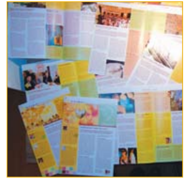
In 2011 verschenen twee externe nieuwsbrieven.

Helaas is het maandelijks door het IKW georganiseerde stageprogramma voor zesdejaars co-assistenten van het LUMC gestopt. Deze kennismaking met psychosociale zorg werd zeer gewaardeerd door de studenten, maar helaas paste het niet langer in het programma.