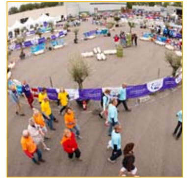
Zo'n 1800 mensen liepen eind mei 24 uur lang voor een betere toekomst: de SamenLoop voor Hoop.

Zo'n 1800 mensen hebben op 28 en 29 mei deelgenomen aan SamenLoop voor Hoop Hillegom-Lisse, een wandelevenement ten bate van KWF Kankerbestrijding. Er werd 24 uur lang gewandeld voor een betere toekomst: minder kans op kanker, meer kans op genezing en een betere kwaliteit van leven voor mensen met kanker. De opbrengst van SamenLoop voor Hoop gaat naar kankeronderzoek.